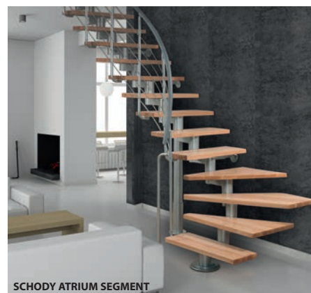
SCHODY ATRIUM SEGMENT