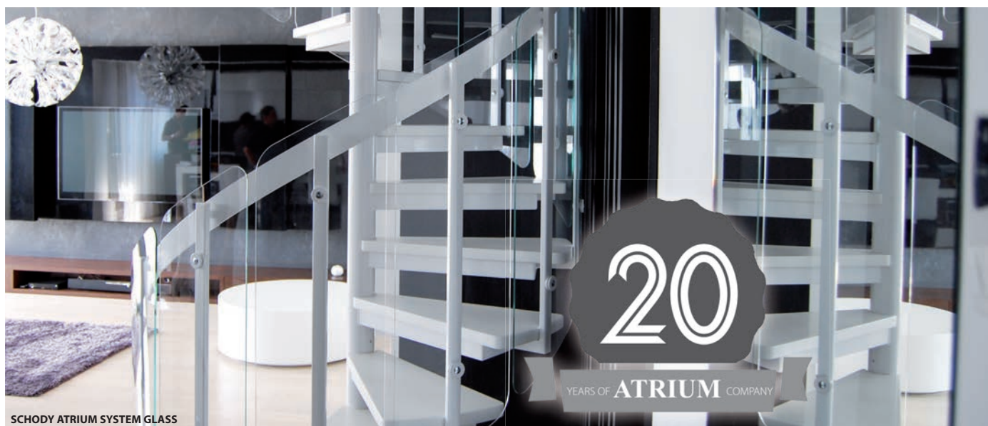
SCHODY ATRIUM SYSTEM GLASS

Schody ATRIUM SYSTEM stanowią połączenie prostoty, nowoczesnego designu i trwałości. Przeznaczone są do samodzielnego montażu. Świetnie wkomponowują się w każdą przestrzeń – zarówno w domach prywatnych, jak też budynkach komercyjnych. Firma Atrium oferuje konstrukcje typowe, ale także możliwość ich wszechstronnej modyfikacji lub wykonania czegoś zupełnie nowego. Od wielu lat Atrium współpracuje z projektantami wnętrz i architektami, promując najnowsze trendy wzornictwa przemysłowego. Atrium jest jedynym polskim producentem w UE, który ma prawo nadawania znaku CE na swoje produkty, co zapewnia klientowi odpowiednią jakość i bezpieczeństwo.