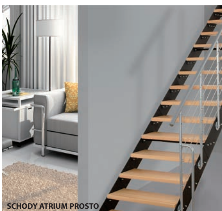
SCHODY ATRIUM PROSTO

Firma Atrium poleca nowe kolekcje: ATRIUM COLOR, ATRIUM BIANCO, ATRIUM RUSTICO i ATRIUM GRAND. Ze wszystkimi kolekcjami można się zapoznać na stronie internetowej www.atriumssystem.eu Wybrane produkty do samodzielnego montażu dostępne od ręki w sklepie internetowym.