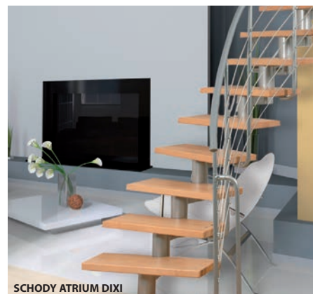
SCHODY ATRIUM DIXI